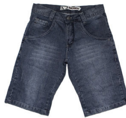
Bermuda Jeans / R$