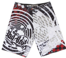
Bermuda / R$ 104,00 150,00