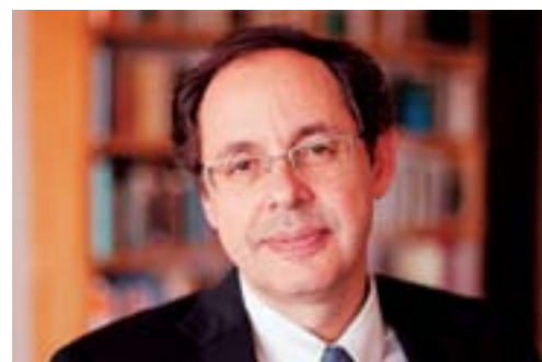
Eduardo Giannetti é a atração do projeto no próximo dia 27 de setembro

Os ingressos estão à venda no site www.eventim.com.br , na Central de Ingressos Brasília Shopping, no Hípica Hall e também pelo call center 4003 6860. O primeiro lote de entradas custará R$ 200. Há também a opção do ingresso vip que, ao valor de R$ 350, dá direito ao coquetel e ao livro autografado. Uma novidade é que o SEBRAE-DF é um dos parceiros do projeto, o que significa que pequenas e micro empresas terão subsídio de 60% no valor das inscrições.