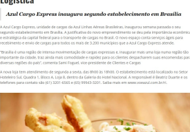
A nova loja irá funcionar na Galeria do Hotel Nacional

O que: 2ª Caixa Brasília Outdoor Adventure – 1ª Etapa 2017 Onde: Local Surpresa a ser divulgado na semana da prova Quando: A Prova será realizada no dia 11 de junho de 2017. Classificação: Idade mínima 18 anos. Patrocínio: CADA e Governo Federal Apoio: SPOT, Oficina Multisport, FR&MOVE, Açul da Amazônia 204 Norte, Adventure Weekend Turismo, Mochila Indiana, Dan Ricardo e Trekking Brasília Quanto: Os primeiros 100 inscritos pagarão a taxa de R$ 250 referente ao 1º lote. Duração: O Percorso Short tem duração média de 2h a 6h e o Percorso Pro de 4h a 10h. Informações: www.brasiliaoutdooradventure.com.br