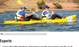
A corrida de aventura será no dia 11 de junho, a partir das 7h, em Brasília

DA EDUCAÇÃO — 30 DE MAIO DE 2017 COMENTÁRIOS: 1 | 2 | 3 | 4 | 5