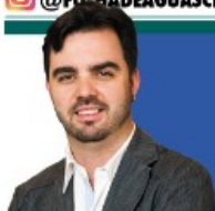
POR FLÁVIO RESENDE